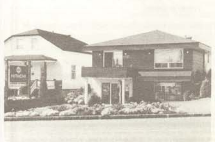
Pour les commerces, A. Petitclerc Électronique du 1694 Notre-Dame a décroché un premier prix.