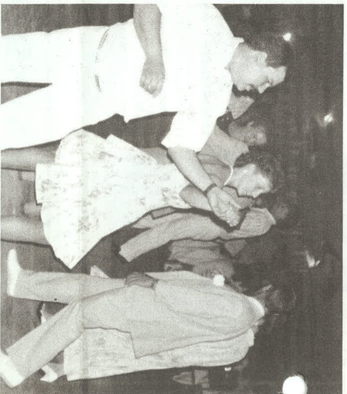
En fin de soirée, c'est: place à la danse!

C'est pour ses services en tant que secrétaire, trésorier et