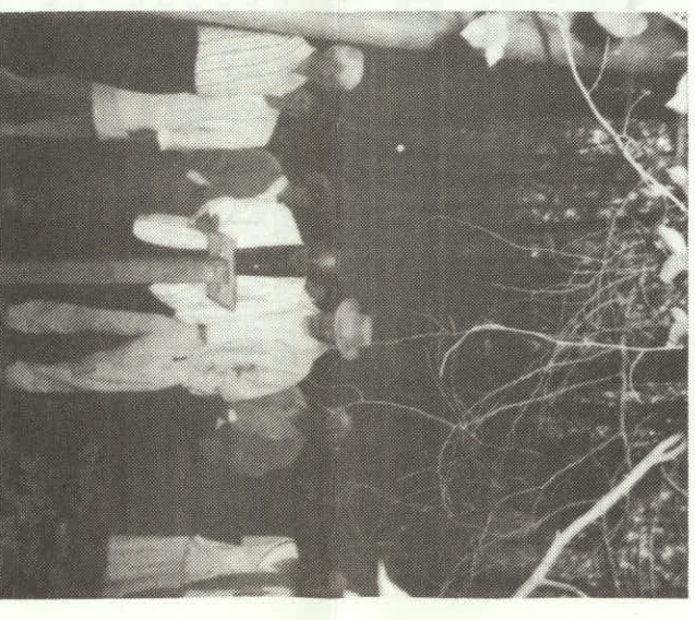
Une ballade le long du sentier écologique d'une longueur de 1,8 km nous fait découvrir seize essences forestières, et, en complément, une description de la faune ailée pouvant y nicher ou se nourrir de ses fruits.