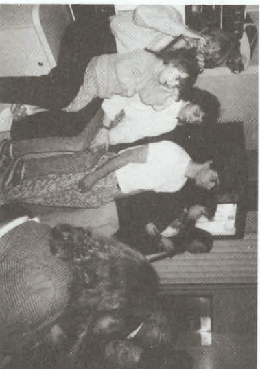
Quelques un(s)es des sinistrés hébergés au Confortel avant la cérémonie de reconnaissance envers leurs hôtes.

L'enclenchement de cette opération par la Ville de L'Ancienne-Lorette, a donné lieu à un immense mouvement de solidarité auquel se sont joints les médias et plusieurs commerces de biens et services dont des hôtels et restaurants de L'Ancienne-Lorette et des environs. Comme la liste des commanditaires et collaborateurs s'allonge tous les jours, nous les présenterons dans la prochaine édition du Lorettaïen. Même les organismes ont apporté leur contribution: le samedi 17 janvier, le 19e Groupe Scouts et Guides de L'Ancienne-Lorette, en collaboration avec Rhythm-O-son, conviait les familles sinistrées à un souper spaghetti avec activités extérieures, animées par les scouts, pour les enfants, et animation musicale à l'intérieur par les membres de Rhythm-O-Son.