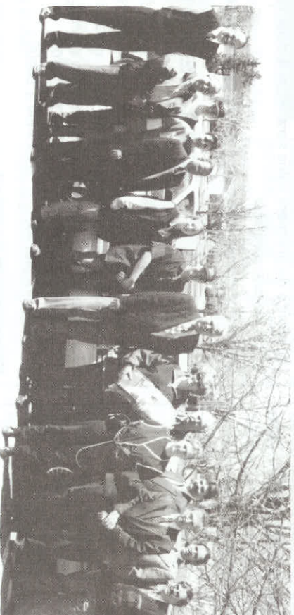
Entourée des cadres municipaux, une représentante de la Croix-Rouge remettant une trousse de survie au directeur-général lors de la journée du 22 avril.

Le meilleur moyen de vérifier l'efficacité d'un plan d'intervention étant de le tester, le Comité de sécurité civile a réuni les substituts des différents responsables de service pour développer le scénario d'un sinistre susceptible de se produire sur notre territoire. L'objectif consistait à reproduire le plus fidèlement possible le contexte qui prévaut en situation de sinistre, soit le stress des intervenants, les nombreuses décisions à prendre rapidement, le caractère imprévisible de l'événement et les conséquences dramatiques qu'une erreur est susceptible d'entraîner.