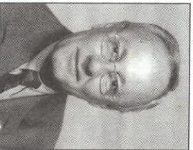
Loretaines et Loretains

LE MAIRE ET LES MEMBRES DU CONSEIL VOUS EXPRIMENT LEUR RECONNAISSANCE