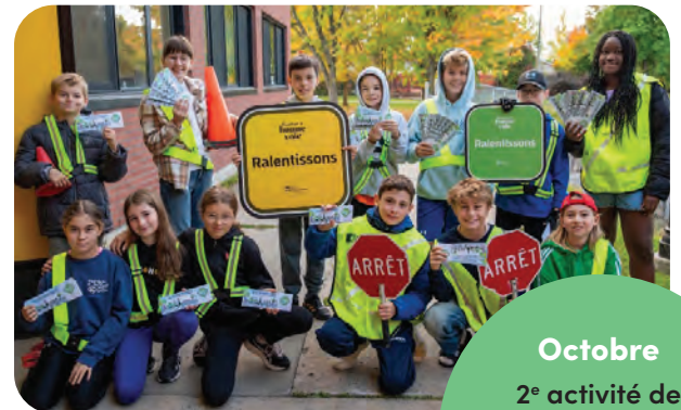
Octobre 2 e activité de sensibilisation à la sécurité routière avec les écoles primaires