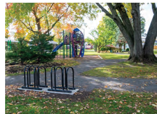
Ajout de supports à vélo dans les parcs de quartier