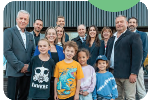
Décembre Distribution de denrées avec Rayon de Soleil