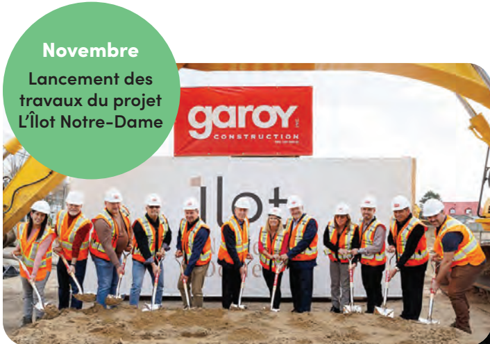
Novembre Lancement des travaux du projet L'Îlot Notre-Dame