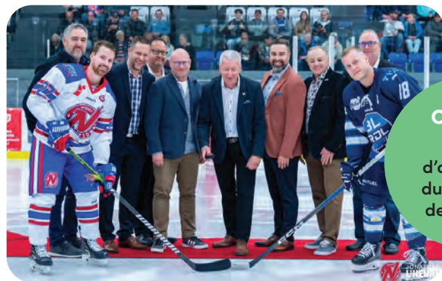
Octobre Match d'ouverture du National de Québec