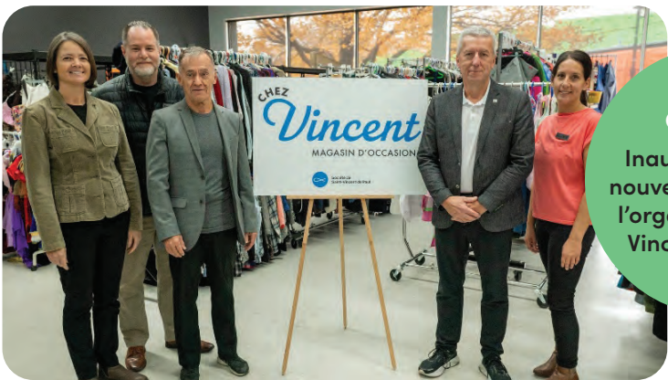
Octobre Inauguration des nouveaux locaux de l'organisme Saint-Vincent-de-Paul