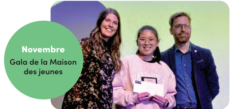
Novembre Gala de la Maison des jeunes