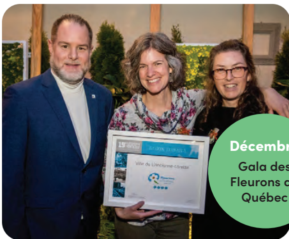
Décembre Gala des Fleurons du Québec