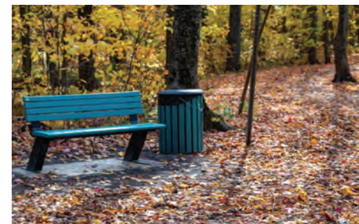
Ajout de bancs dans les sentiers du parc de la Rivière