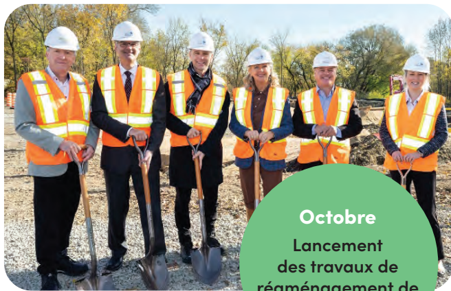
Octobre Lancement des travaux de réaménagement de la rivière Lorette