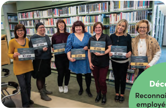
Décembre Reconnaissance des employés cumulant 10 et 15 ans de services

L'automne dernier a été marqué par de nombreux projets significatifs !